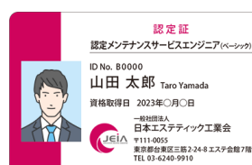
JEIA カード認定証(見本)